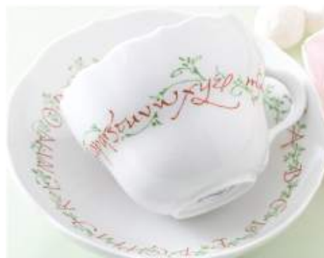
ポーセリン (陶磁器絵付け)