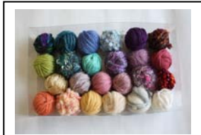
<教材(糸のパレット)のイメージ>