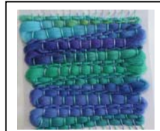
<スワッチのイメージ>